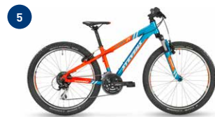
Kinderbike bis 24"